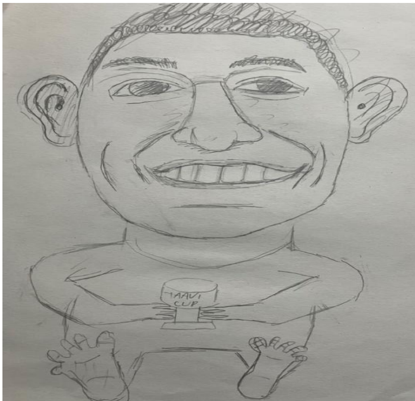
Kylian Mbappe

Lisaks maistele ennustustele on olemas ka taevased ennustused, linnud on pakkinud juba kohvrid, et rännata kõik koos lõunamaale.