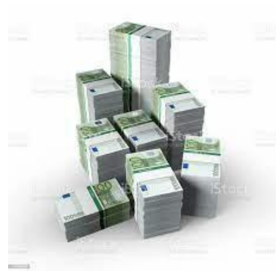
Pilt: Autor IStock, rahahunnik

Nendest vastustest saame järeldada, et enamik inimesi aitaksid teisi või ka ennast, kuid mida teeksid sina miljoniga?