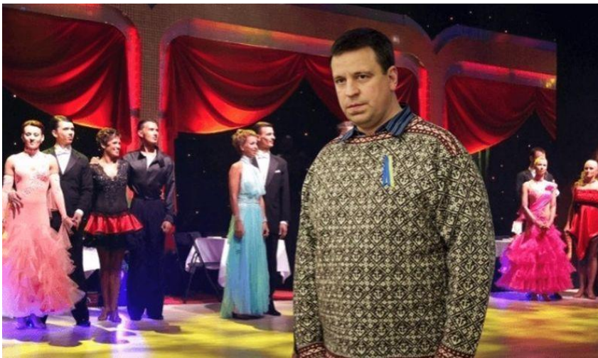
Jüri Ratas tantsplatsil

Mis juhtus: Algas saade „Tantsud tähtedega”, milles osales Keskerakonna esimees Jüri Ratas, aga Jüri Ratase vallutused ei lõppenud seal, korvpallimängus Ukraina vastu viskas Jüri Ratas väga ilusaid 3 punktiseid, aga kokkuvõtteks saaks öelda, et Keskerakonna toetuse tõusu suurim tegur oli Jaanus Karilaidi ebareaalsed lubadused ja valetamised.