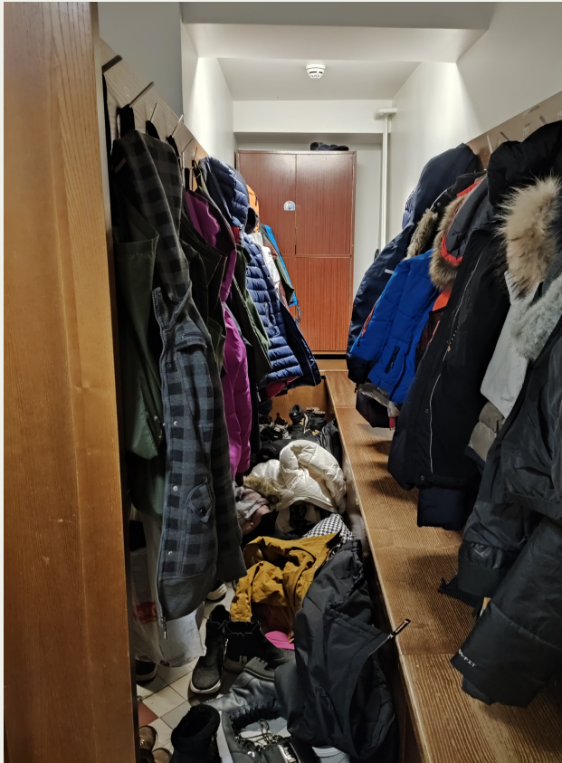
Ise tehtud pildid